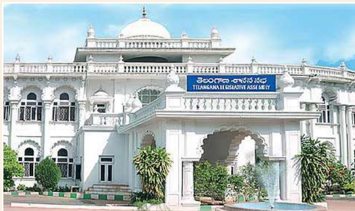
ప్రజాతీర్పు ప్రతినధి, హైదరాబాద్

రెండున్నరేళ్లలో పలుమార్లు మంత్రివర్గ విస్తరణ చేపట్టి కొత్త మంత్రులకు అవకాశం ఇచ్చారు. అయితే, పూర్తిస్థాయిలో మంత్రులను సైతం నియమించుకోలేని స్థితిలో సీఎం రేవంత్ రెడ్డి ఉన్నారని విపక్షాలు ఆరోపణలు గుప్పిస్తున్నాయి. వాస్తవానికి సీఎం రేవంత్ ఈ దిశగా అడుగులు వేసినా.. పార్టీలోని సీనియర్లు కొందరు ఆయన అడుగులకు అడ్డం పడ్డారన్నది వాస్తవం.