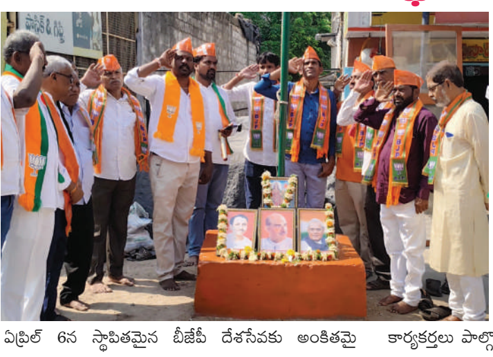
ఏప్రిల్ 6న స్థాపితమైన బీజేపీ చేతనేపకు అంకితమై కార్యకర్తలు పాల్గొన్నారు.