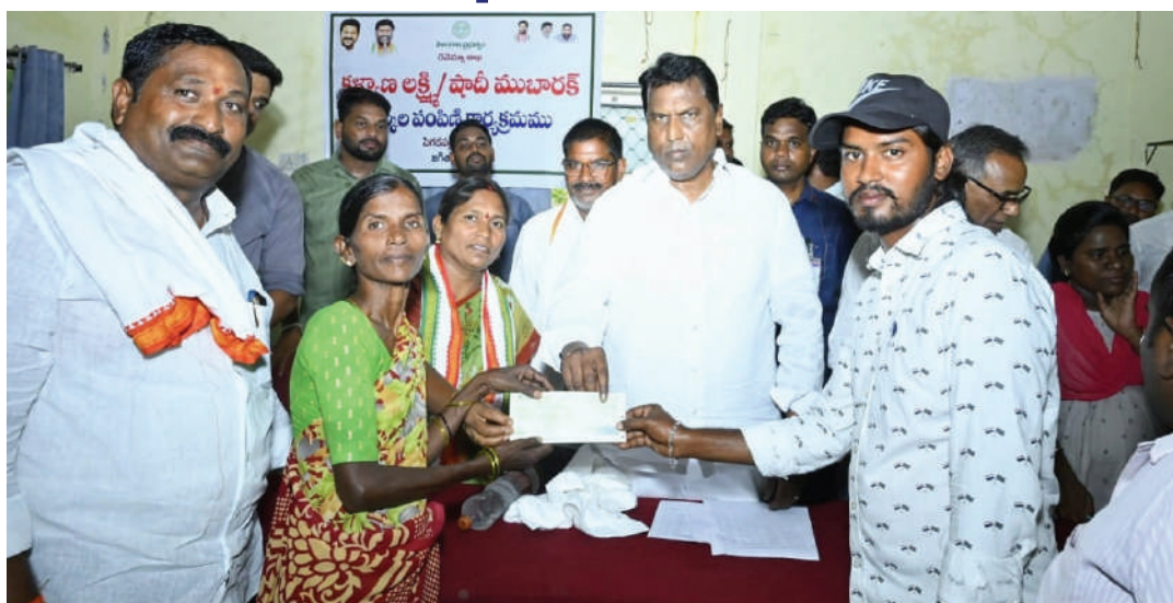
ఇచ్చారు. గ్రామీణ ప్రాంతాల్లో మెరుగైన రవాణా సౌకర్యాల కోసం పెగడపల్లి మండలానికి రూ.2.51 కోట్ల నిధులు మంజూరు చేసినట్లు మంత్రి తెలిపారు. ఈ నిధులతో గ్రామాల మధ్య రోడ్ల నిర్మాణం, మరమ్మతులు చేపట్టి ప్రజలకు మెరుగైన వసతులు కల్పిస్తామని చెప్పారు. అదేవిధంగా, మండల వ్యాప్తంగా చివరి ఆయకట్టు పరకు సాగునీరు అందేలా చర్యలు అమలుచేయాలని, రైతులకు నీటి ఇబ్బందులు లేకుండా చేసి వ్యవసాయాన్ని మరింత అభివృద్ధి చేస్తామని పేర్కొన్నారు. సాగునీటి వసతుల విస్తరణతో పెగడపల్లి మండలాన్ని నన్యశ్యామలం చేయడమే ప్రభుత్వ లక్ష్యమని మంత్రి లక్ష్మణ్ కుమార్ స్పష్టం చేశారు.

జగిత్యాల జిల్లా ధర్మపురి నియోజకవర్గంలోని గ్రామీణ ప్రాంతాల సమగ్ర అభివృద్ధికి అధిక నిధులు కేటాయించి ప్రజల అవసరాలను తీర్చేందుకు కృషి చేస్తానని తెలంగాణ రాష్ట్ర సంక్షేమ శాఖ మంత్రి అడ్డూరి లక్ష్మణ్ కుమార్ తెలిపారు. పెగడపల్లి మండల కేంద్రంలోని ఎంపీడీవో కార్యాలయంలో ఏర్పాటు చేసిన కార్యక్రమంలో 68 మంది లబ్ధిదారులకు సీఎం సహాయ నిధి (జివీ-బి) చెక్కులు, 9 మంది లబ్ధిదారులకు కళ్యాణ లక్ష్మి చెక్కులను మంత్రి పంపిణీ చేశారు. ఈ సందర్భంగా మంత్రి మాట్లాడుతూ, తనపై నమ్మకం ఉంచి ఎమ్మెల్యేగా గెలిపించిన ప్రజలకు సేవ చేయడం తన ప్రధాన బాధ్యత అని అన్నారు. పేద ప్రజల జీవితాల్లో ఆర్థిక భరోసా కల్పించేందుకు రాష్ట్ర ప్రభుత్వం అనేక సంక్షేమ పథకాలను అమలు చేస్తోందని పేర్కొన్నారు. ప్రతి పేద కుటుంబం కలగంటున్న సాంఘిక స్వచ్ఛాన్ని స్థాపించే కార్యక్రమం చేయడమే తన లక్ష్యమని, అందులో భాగంగా అర్హులైన నిరుపేదలకు జూలై నెల నాటికి ఇందిరమ్మ ఇండ్ల మంజూరు ప్రక్రియను వేగవంతం చేస్తామని హామీ