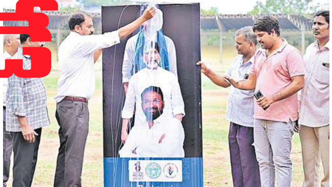
కొత్త సీఎస్ కు దిశా నిర్దేశం..

మెట్రో రైలు ప్రాజెక్టు కూడా దాదాపు కొలిక్కి వచ్చినట్లనే ప్రభుత్వం భావిస్తోంది. ఈ ప్రాజెక్టు కోసం జపాన్ సంస్థల నుంచి మొదల రూ.13,615 కోట్ల రుణం ప్రస్తుతం ఇండియన్ రైల్వే పైనా స్ కార్పొరేషన్ (ఐఆర్ఎఫ్సీ) వద్ద ఇరుక్కుపోయింది. ఇటీవల సీఎం రేవంత్‌రెడ్డి ఢిల్లీకి వెళ్లినప్పుడు కేంద్రమంత్రి కిషన్‌రెడ్డి కలిసి రావడాన్ని ప్రభుత్వం సానుకూలంగా మలుచుకోవచ్చుంది. ఐఆర్ఎఫ్సీ వద్ద ఉన్న రుణాన్ని సాధించుకునే దిశగా చర్యలు చేపట్టింది. ఈ రుణం అందితే.. మెట్రో రైలు రెండో దశ పనులను చేపట్టనుంది. ఇవి కాకుండా ప్రభుత్వం తెలంగాణ పబ్లిక్ స్కూళ్లను అప్రూభిస్తోంది. ఇటీవలే రంగారెడ్డి జిల్లాలోని ఆరుట్లో ఆర్ఎన్ కె హంగులతో తీర్చిదిద్దిన తెలంగాణ పబ్లిక్ స్కూల్‌ను సీఎం ప్రారంభించారు. ప్రతి నియోజకవర్గంలో ఒక టి చొప్పున ఇలాంటి స్కూళ్లను ఏర్పాటు చేయాలన్నది ప్రభుత్వ నిర్ణయం. ఇక ప్యారడైజ్ వద్ద ఉన్న ఆర్ఎన్ కె హంగులతో తీర్చిదిద్దిన తెలంగాణ పబ్లిక్ స్కూల్‌ను సీఎం రేవంత్ లేఖ కూడా రాశారు. కేంద్రమంత్రి కిషన్‌రెడ్డి ఈ విషయంలో చొరవ తీసుకోవాలని విన్నవించారు. పాలమూరు ప్రాజెక్టునూ గాడిలో పెట్టే చర్యలు చేపడుతున్నారు.