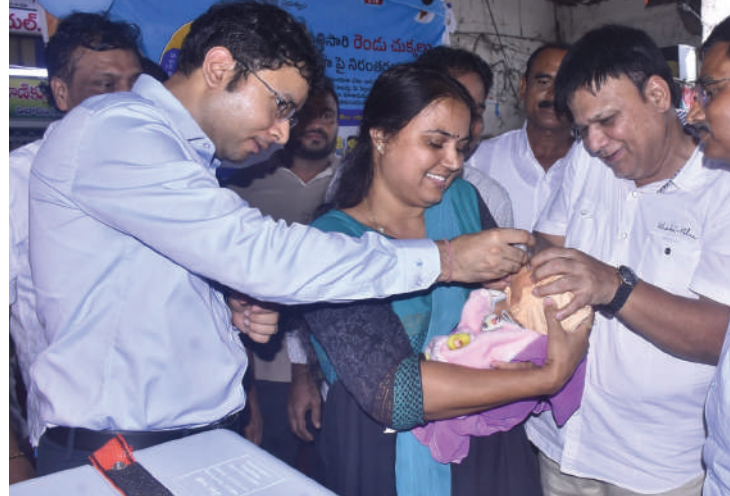
నిరోధక శక్తి మరింత బలోపేతం అవుతుందని తెలిపారు. తల్లిదండ్రులు ఎలాంటి అపోహలకు తావివ్వకుండా తమ పిల్లలను సమీప పోలియో కేంద్రాలకు తీసుకువచ్చి పోలియో చుక్కలు వేయించాలని కోరారు. జిల్లాలో ఒక్క