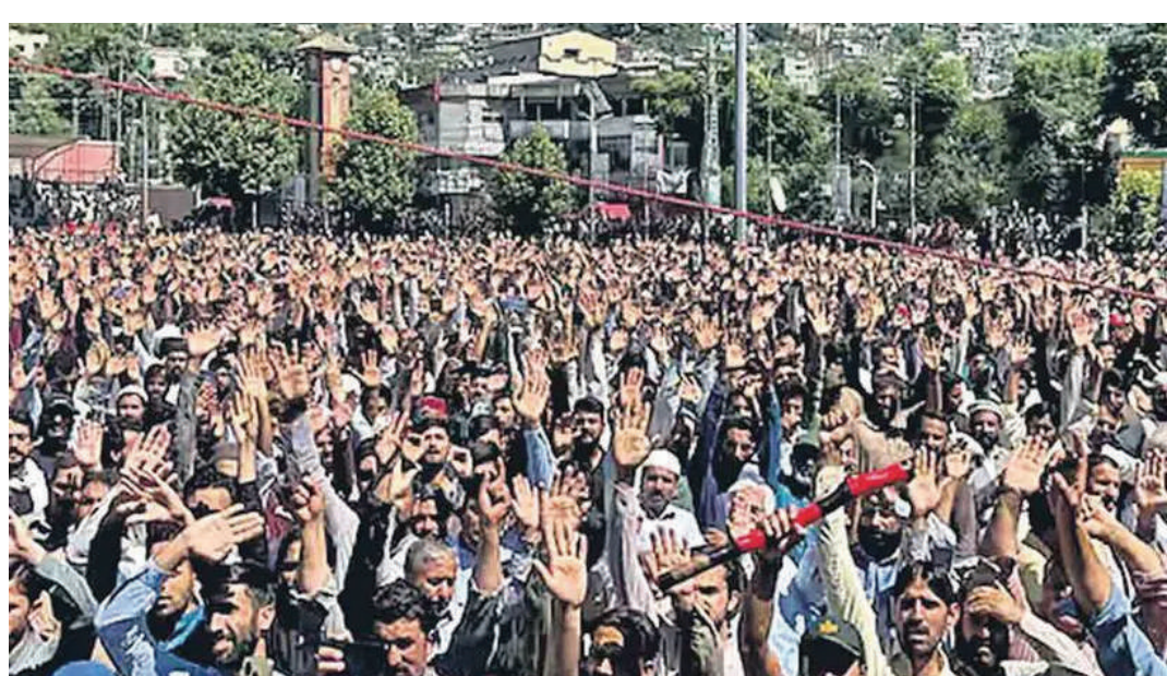
సాధించుకుంటాం" అని భారీ జనసందోహం నిదించడం కనిపించింది. పాకీ ప్రభుత్వ యంత్రాంగానికి వ్యతిరేకంగా స్థానిక బృందాలు ముందు వరుసలో నిలుస్తున్నాయి. రావల్కోట్, హజ్జీయన్ బాలో పాలకులు, భద్రతా సంస్థలను నేరుగా హెచ్చరిస్తూ వీధులు మార్చాయి. నిరసనకారులపై కాల్పులు ఉధృమాన్ని హింసాత్మకంగా అణచివేయడానికి పాకీ ప్రయత్నిస్తున్నది. ముజఫరాబాద్లోని ప్యూచోత్వక నిలం బ్రిడ్జ్ వద్ద, దాదాల్లో పాకిస్థాన్ రేంజర్స్ నిరసనకారులపై కాల్పులు జరిగాయి. ఇందులో కనీసం 8 మంది తీవ్రంగా గాయపడ్డారు. కాల్పుల తర్వాత సైతం నిరసనకారులు భారీ మోటార్ సైకిల్ ర్యాలీలు నిర్వహిస్తూ, సాయుధ పోలీసు విభాగాలను ఎదుర్కొంటూ వీధుల్లో తమ పట్టును కొనసాగిస్తున్నారు.

స్వాతంత్ర్యం మా హక్కు.. తీవ్రమవుతున్న ఆందోళనలు పాకిస్థాన్ ఆక్రమిత కశ్మీర్లో కొనసాగుతున్న పౌర తిరుగుబాటు 27వ రోజుకు చేరుకున్నది. తీవ్రమవుతున్న ప్రభుత్వ అణచివేత, సాయుధ పారామిలిటరీ చర్యలు, కాల్పుల ప్యూచోలను ధిక్కరిస్తూ, పాకిస్థాన్ పాలన నుంచి విముక్తి కోరుతూ నిరసనకారులు ఆందోళన తీవ్రం చేస్తున్నారు. అదే సమయంలో మానవతా సహాయం, ఆహార సరఫరా కోసం భారతదేశంలో పునరీకరణ వైపు మొగ్గు చూపుతున్నట్లు సంతకాలు ఇచ్చారు. ఈ భారీ ప్రదర్శనల్లో అన్ని వర్గాల ప్రజలు పాల్గొన్నారు. కోట్ల ప్రాంతంలో పాకిస్థాన్ ఆక్రమణను పూర్తిగా తిరస్కరిస్తూ వేలాది మంది ప్రజలు ఒకచోట చేరి నినాదాలు చేశారు. "స్వాతంత్ర్యం మా హక్కు మేము మా స్వాతంత్ర్యాన్ని