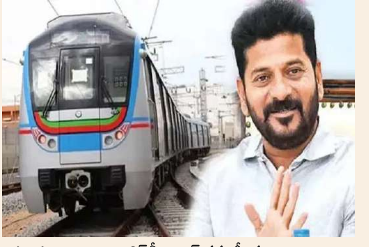
ఎన్టీబీఐ క్యాంపస్ కీలక బాధ్యతలు అప్పగించాలి.. జూన్ 24న జరిగిన సమావేశంలో తీసుకున్న నిర్ణయాలు ప్రకారం.. కేంద్ర ప్రభుత్వం గుర్తించిన సంస్థ ఎస్పీఐ క్యాంపిల్ మార్కెట్స్ - మిగతా 2వ పేజీలో

నెల జూన్ 24వ తేదీన కేంద్ర రైల్వే శాఖ మంత్రి అశ్వినీ వైష్ణవ్, కిషన్ రెడ్డితో పాల్గొన్న సమావేశాల్లో హైదరాబాద్ మెట్రో ఫేజ్-1, ఫేజ్-2 అంశాలపై విస్తృతంగా చర్చించిన విషయాన్ని ముఖ్యమంత్రి రేవంత్ ప్రత్యేకంగా గుర్తు చేశారు. ఆ సమావేశాల్లో తీసుకున్న కీలక నిర్ణయాలు ఇప్పటికీ అమలులోకి రాకపోవడం వల్ల సీఎం రేవంత్ ఆందోళన వ్యక్తం చేశారు.