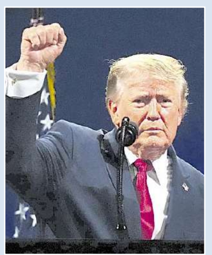
ఎప్పటికీ ఆర్గ్వాసం లోస్.. అమెరికాను ఎట్టిపరిస్థితుల్లోనూ పతనం కానివ్వం 'సెల్యూట్ అమెరికా' వేడుకలో అధ్యక్షుడు ట్రంప్ స్పష్టికరణ వాషింగ్టన్: అమెరికా 250వ స్వాతంత్ర్య దినోత్సవాన్ని అధ్యక్షుడు డొనాల్డ్ ట్రంప్ అత్యంత ఆనందకరమైన, అద్భుతమైన మైలురాళ్లలో ఒకటిగా అభివర్ణించారు. స్వాతంత్ర్య దినోత్సవాన్ని పురస్కరించుకొని శనివారం రాజధాని వాషింగ్టన్ లోని నేషనల్ మార్షల్ 'సెల్యూట్ అమెరికా' పేరిట నిర్వహించిన కార్యక్రమంలో - మిగతా 2వ పేజీలో