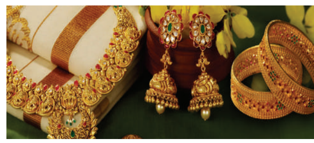
కొనడం తెలివైన వనా, లేక ధరలు తగ్గే వరకు వేచి బంగారం

గత కొన్ని రోజులుగా బంగారం, వెండి ధరలు క్రమంగా దిగి వస్తున్న క్రమంలో ఉన్నట్టుండి మళ్ళీ పరుగులు పెడుతున్నాయి. గత కొన్ని రోజులుగా దేశీయంగా పసిడి ధరలు రికార్డు స్థాయిలో పడిపోతుండటం ధరల సుంచి ఉపశమనం పొందుతున్న మహిళలకు ఇప్పుడు.. బంగారం, వెండి ధరలు నిరంతరం కొత్త రికార్డులు సృష్టిస్తున్నాయి. ఈ వారం బంగారం ధర రూ.6,000కు పైగా, వెండి ధర రూ.17,000కు పైగా పెరిగింది. వీజిలో 10 గ్రాముల బంగారం ధర రూ.1.47 లక్షలకు, కిలో వెండి ధర రూ.2.40 లక్షలకుపైగా ఎగబాకింది. ఇప్పుడు బంగారం